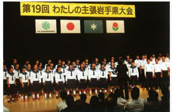
アトラクションでは、協力校の滝沢南中学校3年生が合唱を発表