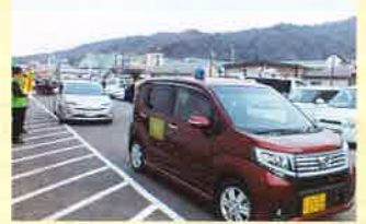
— 地区防犯協会 防犯ボランティアの活動紹介 — 水沢地区防犯協会連合会「真城地区防犯協会」