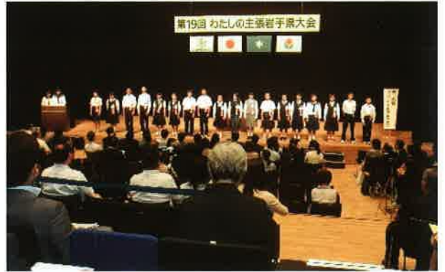
各地区代表の18名の発表者