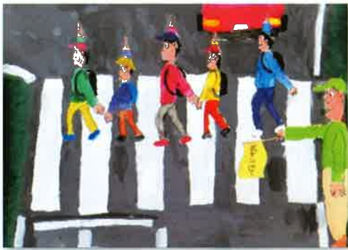
防犯ボランティアの活躍の部