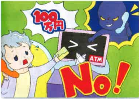
振り込め詐欺被害防止の部